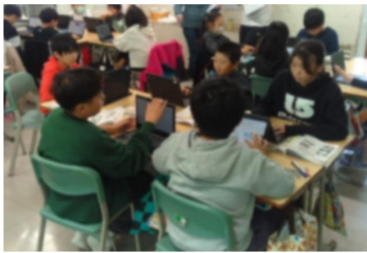
5年生 社会 ICTを活用した対話の様子